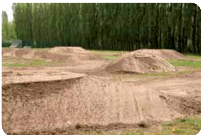
BMX terreintraining circuit

We zien door deze kleine aanpassingen het Binnengebied uitgroeien tot een volwaardige recreatiezone die perfect aansluit bij onze huidige sportinfrastructuur: sporthal, basket-petanque en skateterrein. Zo ziet u maar, weer al een “sport-voor-allen” aanbod.